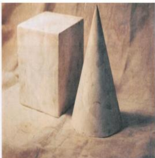
几何石膏体实物照片