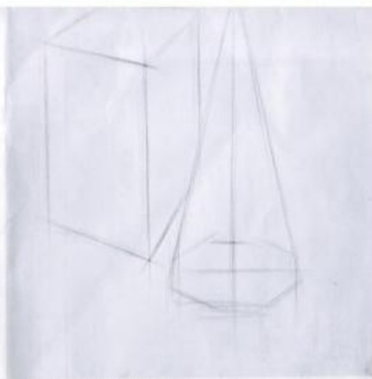
① 分析透视变化，定出基本型，找到主要结构，削掉冗余。