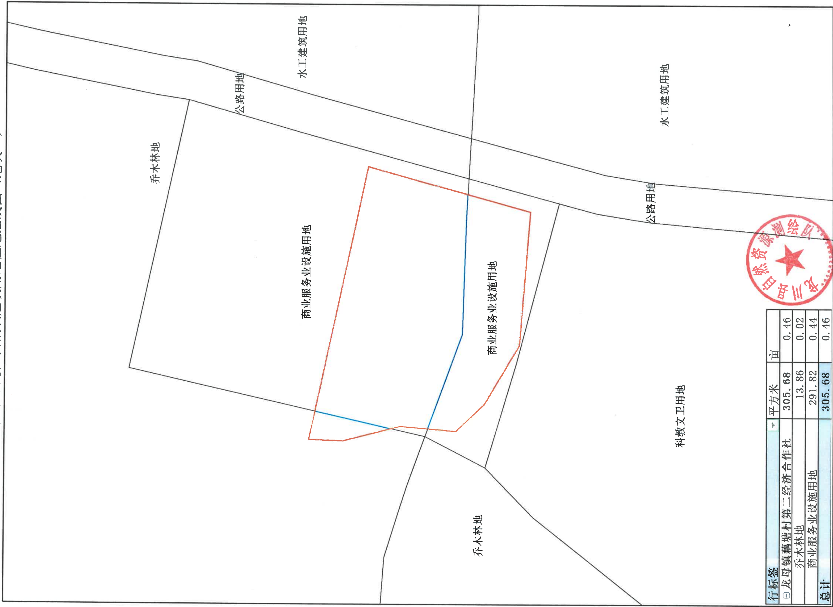
2022年度第十九批次城镇建设用地征红线图（地块一）